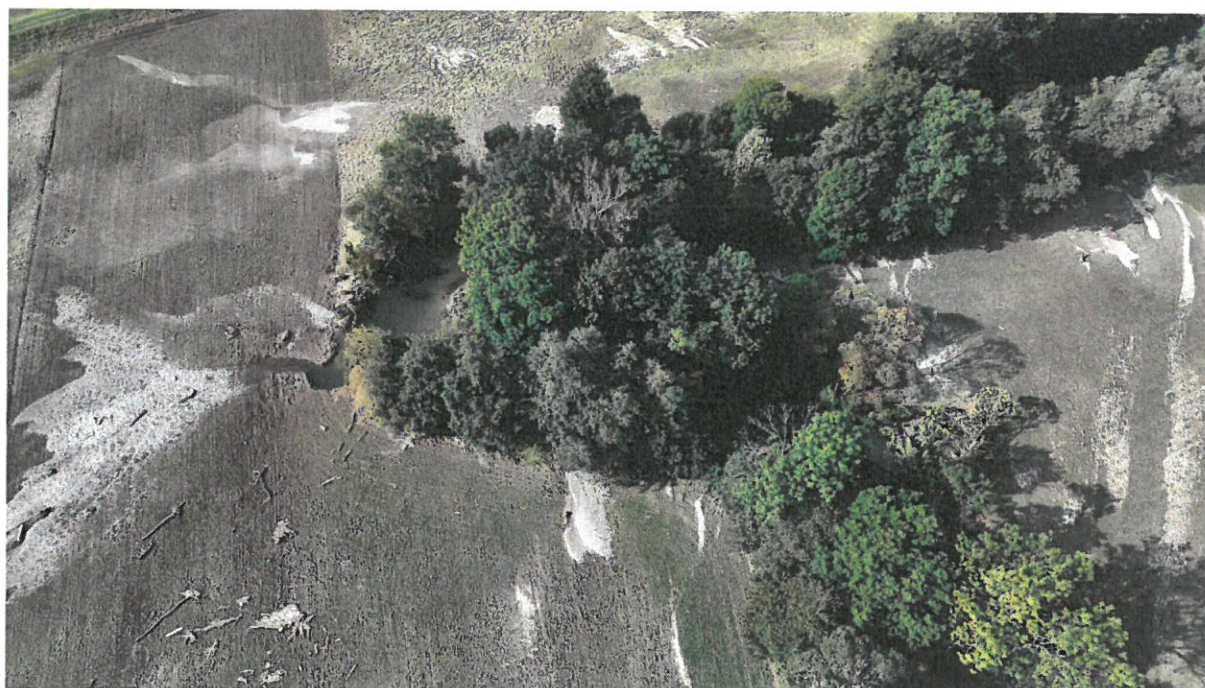
Morava, PB nátrž, ř.km 291,00