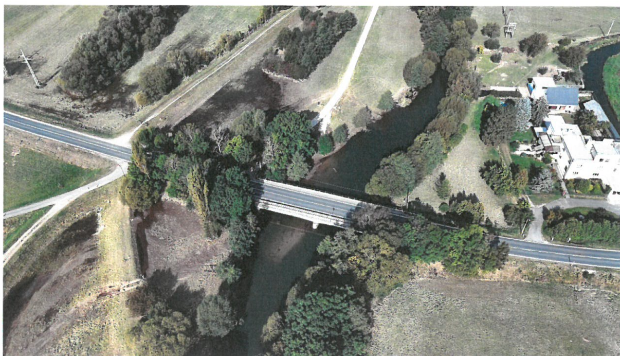
Morava, nános pod mostem, ř.km 291,23