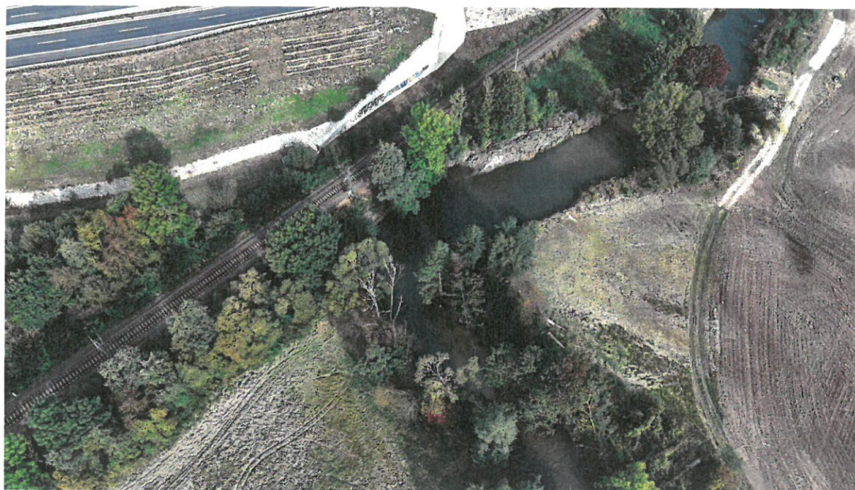
PB nátrž u železnice Morava, km 286,57