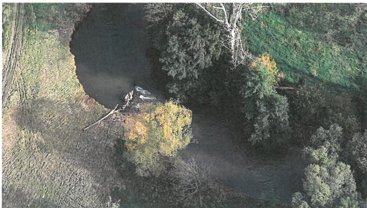
LB i PB nátrž Morava, km 286,07